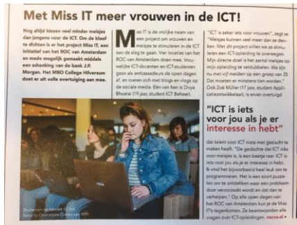
Artikel uit de Gooi en Eemboord

2017 was er een tafel met een ambassadeur. Het doel van MISS IT is meer vrouwen in de ICT te werven.